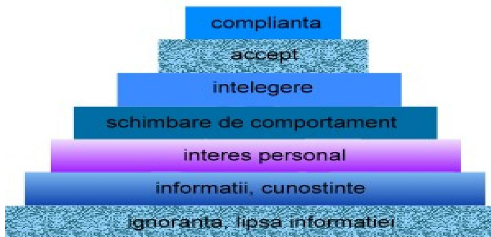
Figura 1. Treptele necesare obținerii unei schimbări eficiente și durabile de comportament

Problematica responsabilității individuale și a celei sociale în raport cu starea de sănătate oro-dentară este redată în schema lui Einwag, care marchează etapele necesare obținerii unei schimbări eficiente și durabile de comportament.