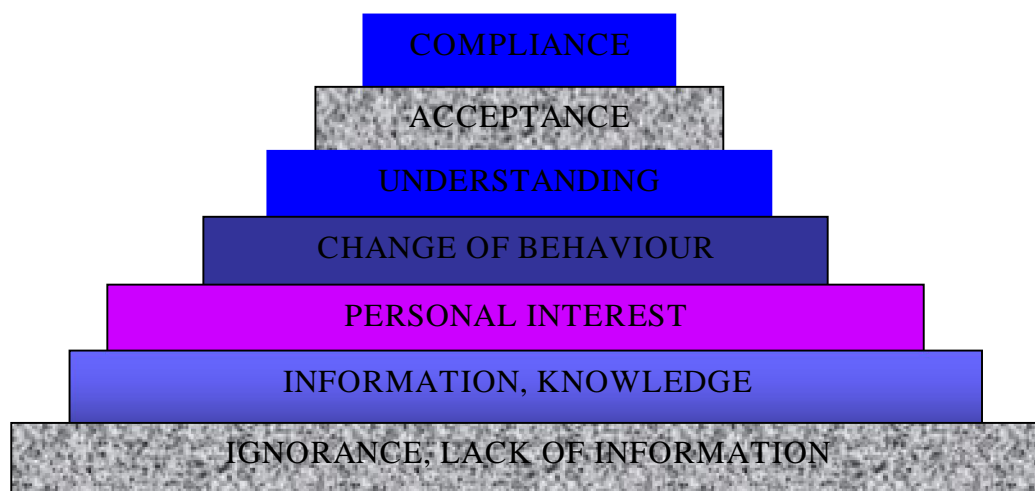
Picture 1. The steps which are necessary for obtaining efficient and long lasting changes of Einwag behavior

The issue of the individual responsibility and of the social responsibility in comparison with the oral state of health is presented in Einwag's scheme, which shows the necessary stages for obtaining efficient and lasting changes of behavior.